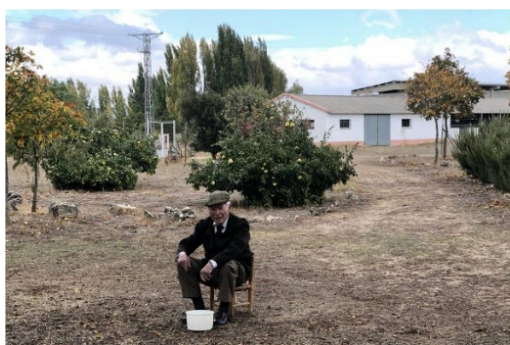
En su finca de Palencia

Entre su buena salud y su autodisciplina, llegó a una fecha muy especial como fue la de su 100 cumpleaños, que lo celebró rodeado de toda su familia y amigos.