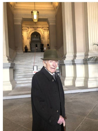
En el Ministerio de Agricultura, con casi 103 años

En este último acto, al volver a su entorno de Servidor Público, lo que tenía muy a gala y añorando hasta cierto punto esa actividad, nos comentó: “¡Cuántas veces he pasado yo por esta puerta!”.