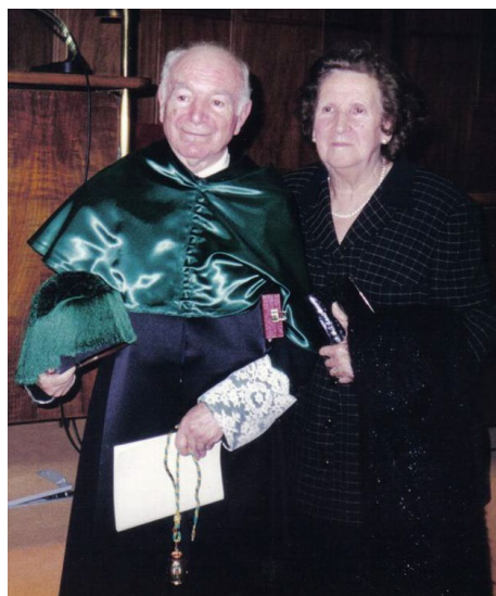
Con su eterna compañera

Aún después de este último ingreso académico, siguió participando en tareas de corrección de tesis doctorales, en actividades de las distintas academias de las que era miembro y, especialmente, colaborando en la celebración del Centenario del Cuerpo Nacional Veterinario (además de la profusa colaboración en el Cincuentenario del mismo Cuerpo).