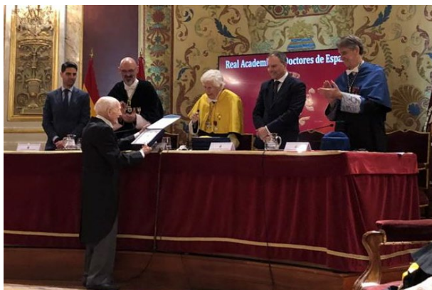
Sesión homenaje en la Real Academia de Doctores de España

Con casi 103 años, enero de 2024, otro reconocimiento a su trayectoria profesional, esta vez por parte de la Real Academia de Doctores de España, en el acto de Apertura del Curso Académico de ese año, y en abril, el recibido en el Ministerio de Agricultura con motivo de la Asamblea General Anual de la Asociación del Cuerpo Nacional Veterinario.