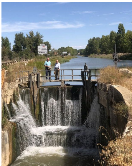
En el Canal de Castilla

Su edad no fue impedimento para continuar manteniendo su inquietud intelectual. Todavía seguía interesado en aumentar sus conocimientos realizando “viajes culturales” a sitios tan dispares como el Canal de Castilla, del que es autor de una pequeña monografía, o localizando detalles genuinos como el órgano exento de la iglesia de Támara de Campos.