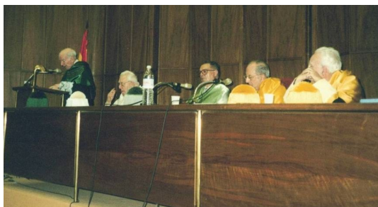
Discurso de ingreso en la Real Academia de Doctores

Hasta ese momento los hijos no éramos conscientes del extenso curriculum de nuestro padre. Por ello cuando le comentamos al respecto de habernos mantenido en esa ignorancia de méritos, su respuesta fue: “Para mí, mis mayores méritos sois vosotros”.