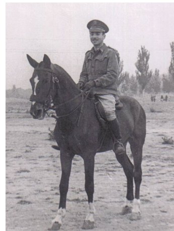
En las Milicias Universitarias; La Granja, Segovia

Terminó la carrera de Veterinaria en junio del año 1944. Durante el verano de ese mismo año vuelve al campamento para alcanzar el grado de Alférez Eventual de Complemento.