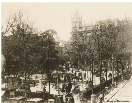
Plaza de Santa Ana; circa 1920