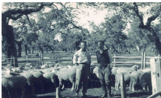
Granja Céspedes; Badajoz

Ya con su Título Universitario, finales del año 1944, comenzó el ejercicio libre de la profesión iniciando su andadura como Veterinario en actividades tan variadas como la realización del Cursillo para ingresar en el Cuerpo de Inspectores Municipales Veterinarios, obtención de beca para estudios de Economía Ganadera en la Estación Pecuaria Regional de Badajoz y Matadero Provincial de Mérida, Profesor de la Escuela Regional de Agricultura “Fundación Quirós” (Cóbreces; Cantabria) o siendo becado para una ampliación de estudios en Italia (Milán y Turín).