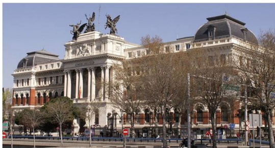
Ministerio de Agricultura