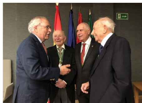
Homenaje en el Colegio Oficial de Veterinarios de Madrid

Los homenajes seguían llegando, y en el año 2023 recibió en el Colegio Oficial de Veterinarios de Madrid una medalla de oro por su trayectoria profesional.