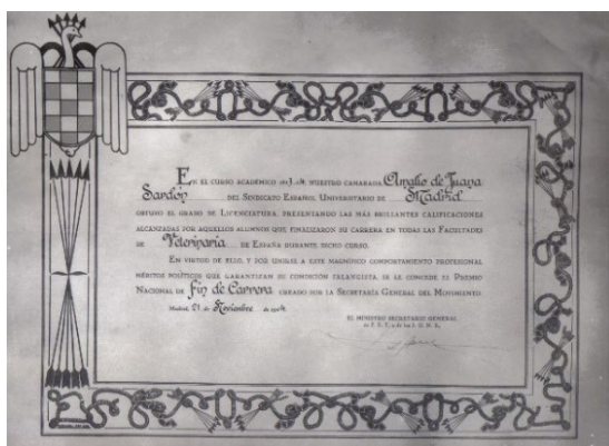
Diploma Premio Nacional Extraordinario Fin de Carrera

Al haber sido el mejor expediente académico de todas las Facultades de Veterinaria de España, en octubre de 1944 recibe el Premio Nacional Extraordinario de Fin de Carrera en un solemne acto en el Paraninfo de la Universidad Complutense.