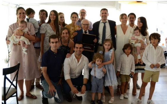
La Familia Menor

La familia siguió creciendo hasta los ocho nietos y nueve bisnietos. Todos ellos adoraban al “superabu”, como les gustaba llamarlo.